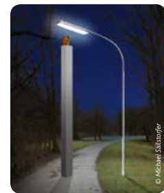
Entwurf „Solarkatze“ von Michael Sailstorfer

Im Sommer 2016 findet die vierte Auflage des Braunschweiger Ausstellungsformats Lichtparcours statt. Bei dieser Ausgabe werden im Stadtzentrum neu entwickelte Kunstwerke internationaler Künstlerinnen und Künstler gezeigt, deren Fokus darauf liegt, rund um die Uhr entdeckt werden zu können. Dabei bedienen sich die eingeladenen Künstlerinnen und Künstler unterschiedlicher Strategien der Intervention in den öffentlichen Raum.