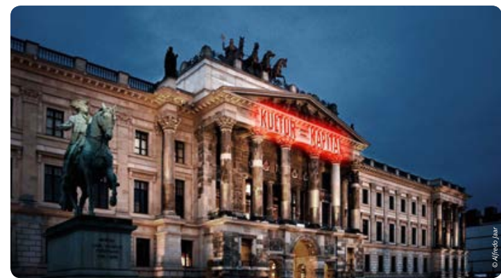
Entwurf „Kultur=Kapital“ von Alfredo Jaar

Insgesamt werden es 15 Lichtinstallationen in der Innenstadt und auf dem Hafengelände sein, die auf der Oker mit einem Floß oder Kahn, auf dem Fahrrad, mit dem Segway oder zu Fuß besucht werden können. Dabei eröffnen sich spannende Perspektiven auf die speziell für Braunschweig entwickelten Kunstwerke.