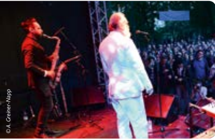
Das Festivalzentrum im Theaterpark ist der richtige Ort, um nach den Vorstellungen die Abende ausklingen zu lassen.