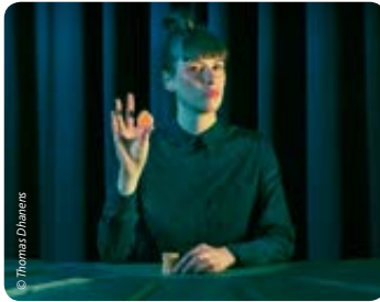
Was Theater alles sein kann: Kapitalismus-Kasino zum selber Zocken, ein Firmenrundgang zum modernen Ablasshandel in der Innenstadt und ein herzerreißendes Melodram im Großen Haus.

E lf Tage, die es in sich haben: über 100 Programmpunkte mit Theater aus aller Welt, Live-Musik im Festivalzentrum – der schönsten Sommerlocation Braunschweigs – und einem ausgeklügelten Rahmenprogramm mit Aufwärmtrainings, Cool-downs und Diskussionen.